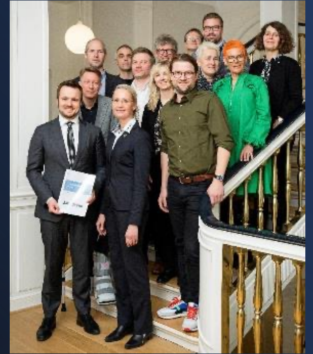
Formand for SMV:Digital